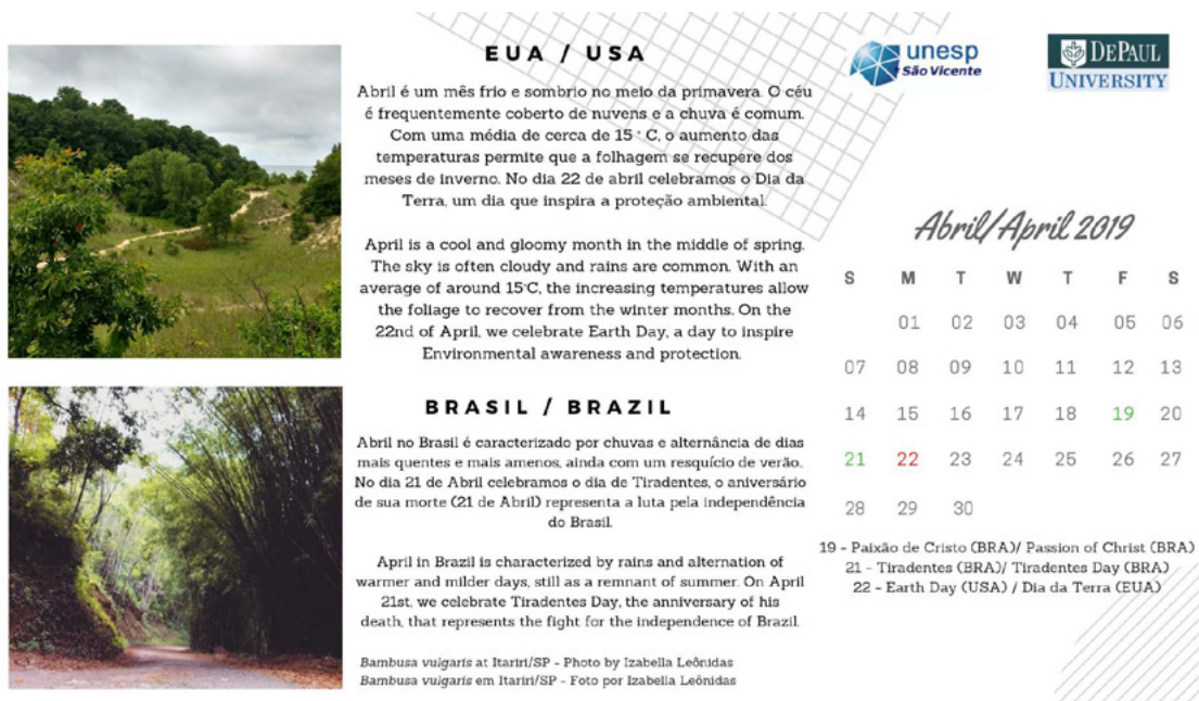
Figura 1. Calendário produzido em conjunto pelos alunos brasileiros e estadunidenses