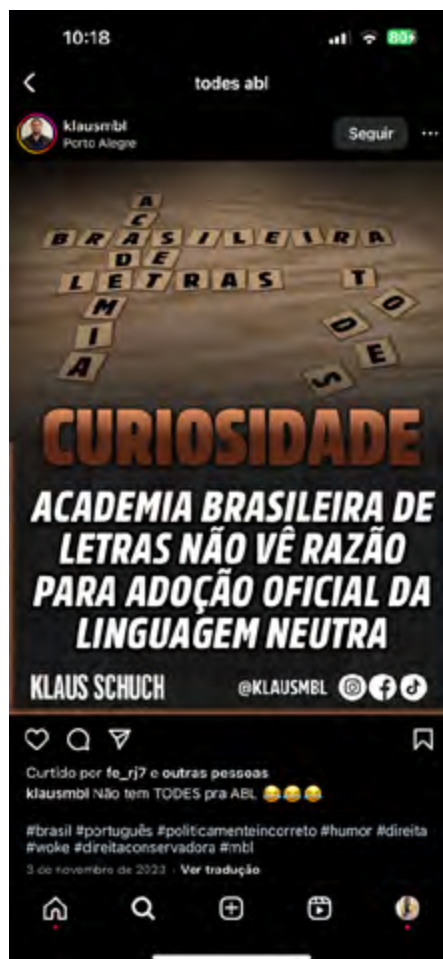
Figura 1. Print “ecológico” de postagem no Instagram

De acordo com Maingueneau (2008a), a linguagem nunca é neutra; ela está imbricada em uma rede de significados culturais e sociais, e os discursos populares sobre a língua são um reflexo das disputas que permeiam essa rede. Observemos, a seguir, a Figura 1.