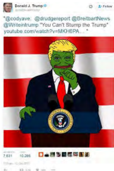
Figura 4. Tweet de Donald J. Trump, publicado em 13 de outubro de 2015.