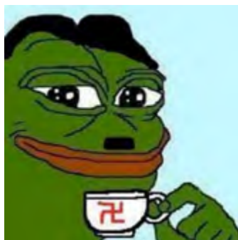
Figura 2. Pepe emulando Adolf Hitler.