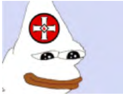
Figura 3. Pepe como representante do grupo supremacista branco, Ku Klux Klan