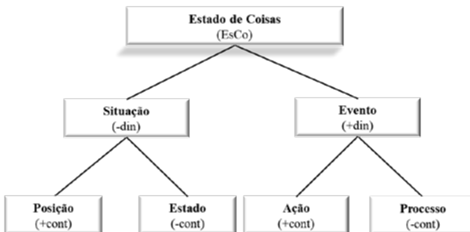
Figura 1. Tipologia de EsCo proposta por Dik (1997)

A combinação dos traços semânticos [dinamicidade] e [controle] permite a elaboração de uma tipologia de estado de coisas (EsCo), composta pelas categorias: Situação de Posição, Situação de Estado, Evento de Ação e Evento de Processo (Dik, 1997):