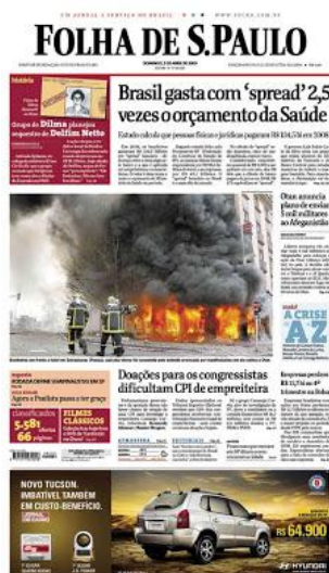
Figura 5.

De acordo com André Lopes 6 , essa ficha policial é falsa. Ela foi publicada no jornal Folha de S. Paulo em 05 de abril de 2009, mas “essa falsificação circula pelo menos desde 30 de novembro do ano passado [2008] na internet, postada no