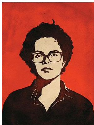
Figura 2. Fonte: http://revistaepoca.globo.com/Revista/Epoca/0,,EMI163155-15223,00-DILMA+NA+LUTA+ARMADA.html . Acesso: 20 jul. 2012