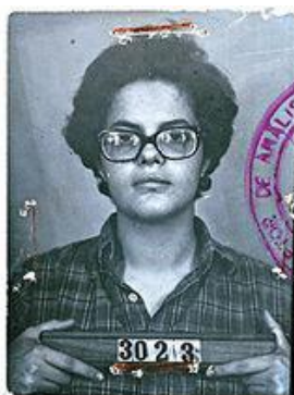
Figura 6.

Conforme Suwvan (2010), o rosto dessa fotografia “mostra uma jovem abatida e desgrenhada, presa pela repressão aos 22 anos”. O olhar expressa tristeza, apesar de o reflexo dos óculos dificultar a visibilidade.