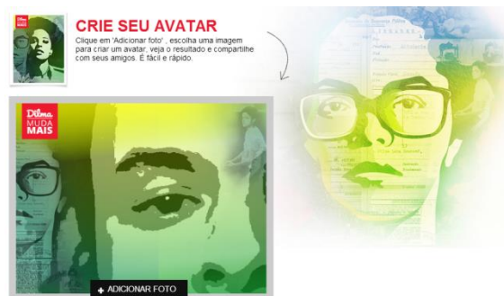
Figura 3.

São percursos de interpretação contraditórios que se materializam em diversos suportes, nos quais as narrativas do acontecimento factual disputam um e não outro sentido para a imagem fotográfica. Em algumas narrativas, são construídos percursos de sentidos que caracterizam Dilma Rousseff como guerrilheira e, em outras, Dilma Rousseff é caracterizada como militante. E nossa análise corrobora a relevância dos mídiuns na construção dos sentidos.