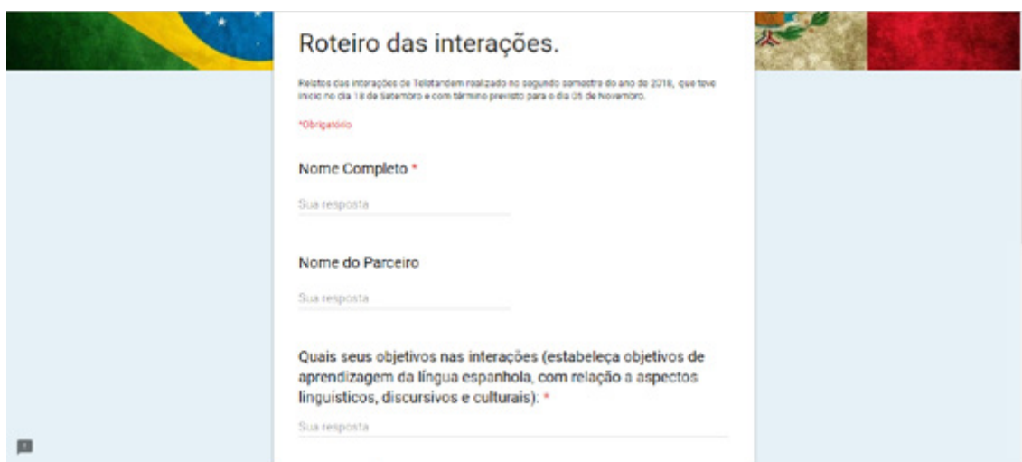
Figura 1. Roteiro das interações UNESP – UNAM, 2º sem. 2018

Com a finalidade de conduzir a reflexão sobre os objetivos de aprendizagem , utilizamos um pequeno roteiro , que deveria ser iniciado, em parte, desde a realização da primeira interação, e respondido, posteriormente, ao final de todas as sessões, em formulário específico, por meio da ferramenta google.docs ( docs.google.com ), conforme segue: