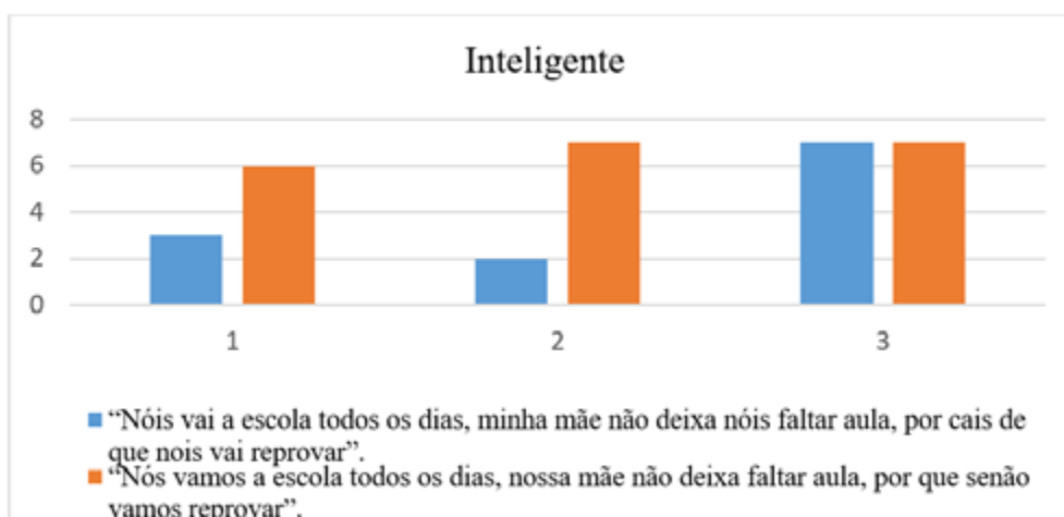
Figura 2. Médias das notas atribuídas ao adjetivo inteligente

Diante dos dados mencionados, passamos agora à análise do teste de atitudes linguísticas aplicado às três professoras participantes da pesquisa. Esse teste consistiu na apresentação de dois trechos escritos, cada um representando uma variedade linguística distinta. Após a leitura desses fragmentos, as participantes foram convidadas a atribuir uma nota, em uma escala de 1 a 7, para cada uma das seguintes qualificações: inteligente, honesto, competente, rico, simpático e boa pessoa. Os trechos utilizados foram fragmento 1 – “ Nóis vai a escola todos os dias, minha mãe não deixa nóis faltar aula, por cais de que nóis vai reprovar ”; trecho 2 – “ Nós vamos a escola todos os dias, nossa mãe não deixa faltar aula, por que senão vamos reprovar ”. Apresentamos em seguida as figuras com os resultados de cada um dos adjetivos avaliados pelos participantes em relação às médias atribuídas para as qualificadoras.