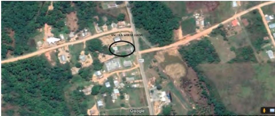
Figura 1. Localização da Escola Santa Luzia