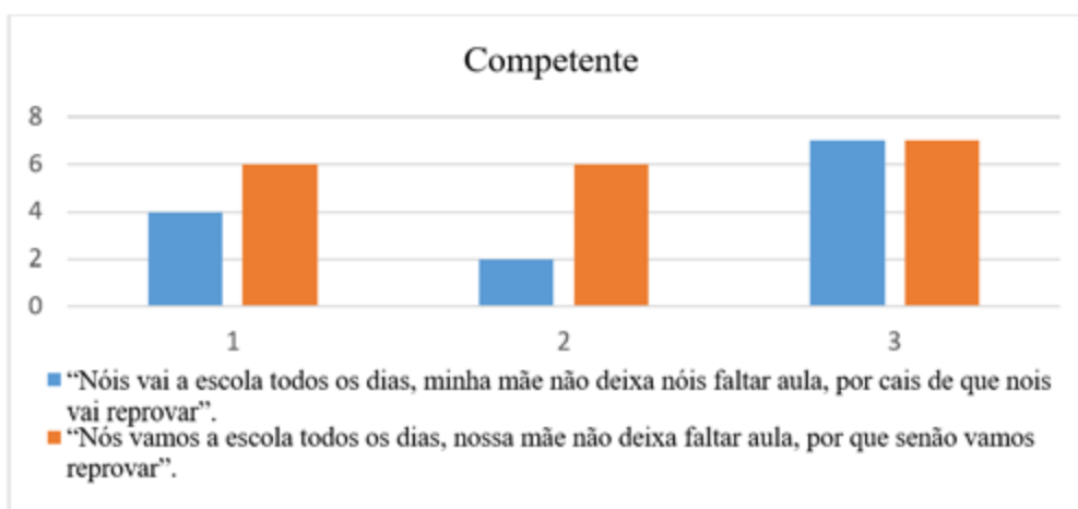
Figura 3. Média das notas atribuídas a “competente”

Em relação à qualificadora “competente” (Figura 3), os valores mais elevados foram atribuídos ao fragmento 2, que representa a fala mais próxima da variedade padrão. Os índices mais baixos foram destinados ao fragmento 1, que utiliza uma linguagem mais informal. Dessa forma, é possível constatar que, para a maioria das participantes, a competência está diretamente relacionada ao uso da variedade padrão. Apenas a professora PR-A3 atribuiu valores iguais para ambos os trechos, sinalizando uma postura mais aberta e consciente quanto à diversidade linguística.