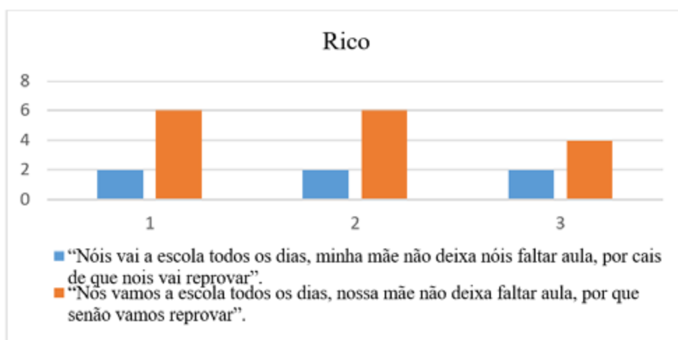
Figura 4. Média das notas atribuídas a “rico”

Com relação à qualificadora “rico”, as notas mais baixas foram atribuídas ao trecho 1, o que nos direciona a um julgamento de caráter mais conservador. As professoras apresentaram avaliações semelhantes nesse quesito. Assim, os índices mais elevados foram destinados ao trecho 2, que representa o uso da variedade padrão da língua. Nesse contexto, constata-se que, para as professoras participantes deste estudo, a associação entre riqueza e o uso da variedade padrão da língua reflete uma percepção de prestígio social, como ilustrado na Figura 4.