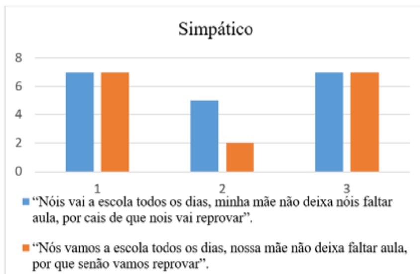
Figura 6. Média das notas atribuídas para “simpático”

na percepção de simpatia, sendo ambas as variações igualmente capazes de caracterizar uma pessoa simpática.