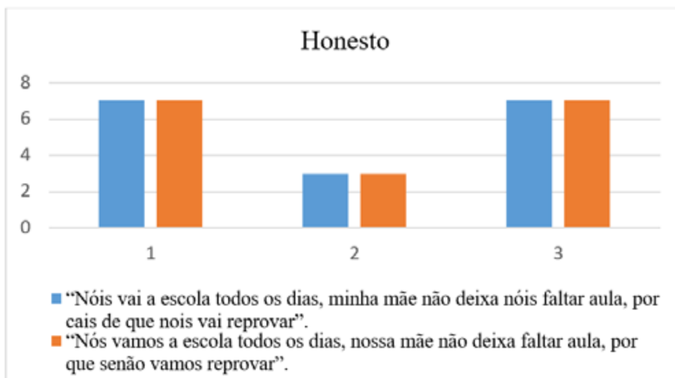
Figura 5. Média das notas atribuídas para “honesto”